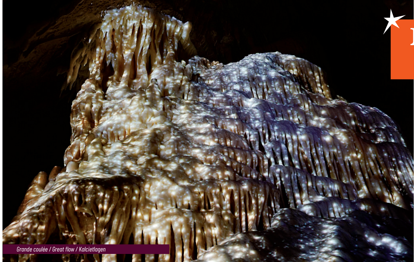
Grande coulée / Great flow / Kalciëtlagen