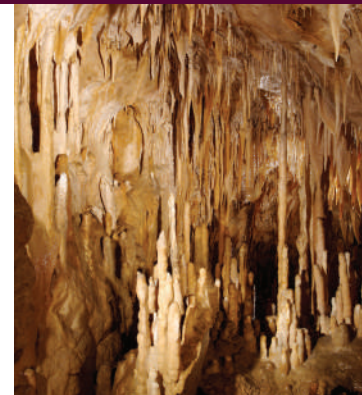
Salle des peintures / The painting chamber / Zaal van de schilderijen