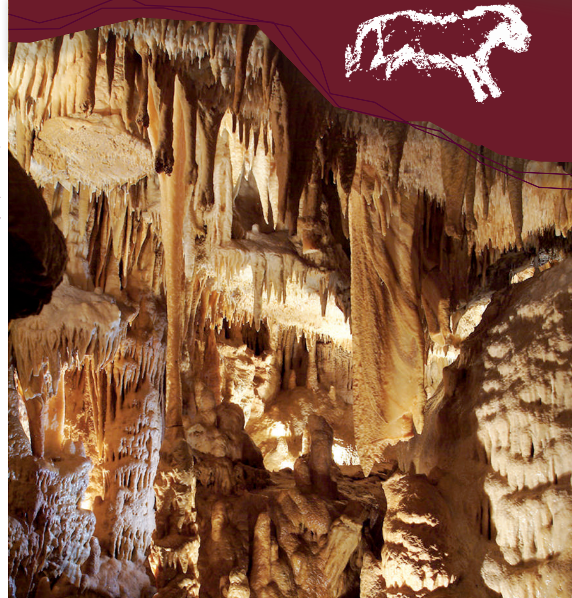
© 2024 - Photos PUPIMAGE - DARPIN - Tous droits réservés - Carte asbury® - Reproduction même partielle interdite