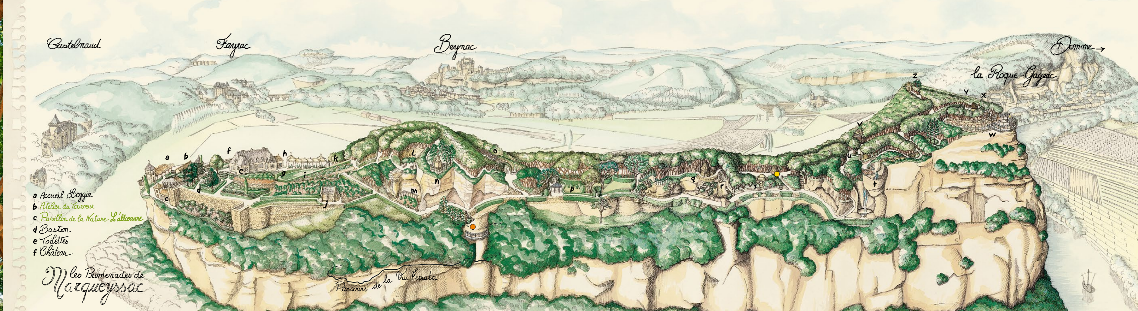
L'allée des arches

La taille des buis Les buis sont taillés entièrement à la main deux fois par an : au printemps et à la fin de l'été. The Boxwood is hand trimmed twice a year, in the spring and at the end of summer.