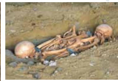
Reconstitution d'une sépulture de l'âge du bronze découverte en 1912

De cet extraordinaire labeur reste aujourd'hui un site de référence mondiale en matière d'architecture troglodytique tant par ses dimensions que par son nombre d'habitats et la variété des aménagements laissés sur les parois.