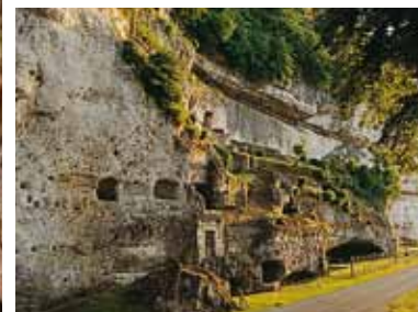
Gisement préhistorique au pied de la falaise