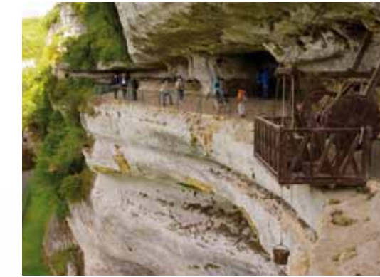
Le treuil de puits et la terrasse