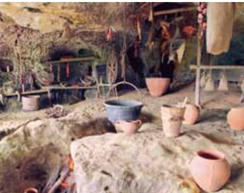
Cuisine de l'An Mil