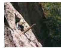
Salle de guetteur creusée dans la roche

Aux périodes historiques, les hommes n'ont pas abandonné les lieux, bien au contraire,