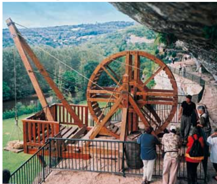
Réplique exacte en état de marche d'un treuil à tambour