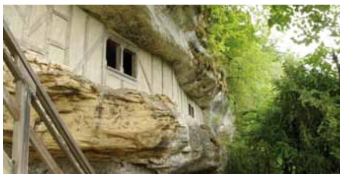
Habitat médiéval reconstitué

Silex taillés, os gravés, instruments de musique, armes et outils préhistoriques ainsi que des sépultures de nos lointains ancêtres. Ces collections témoignent de la présence humaine à la Roque St Christophe depuis au moins 55 000 ans jusqu'à l'aube des temps modernes.