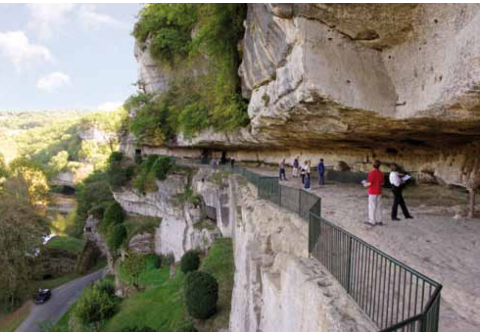
Le grand abri de 400 mètres mondialement connu sous le nom de «Boulevard de l'Humanité»

Remarquable par ses formes puissantes, son nombre d'habitats et son ancienneté d'occupation par l'homme, ce site constitue un cadre d'une rare et sauvage beauté.